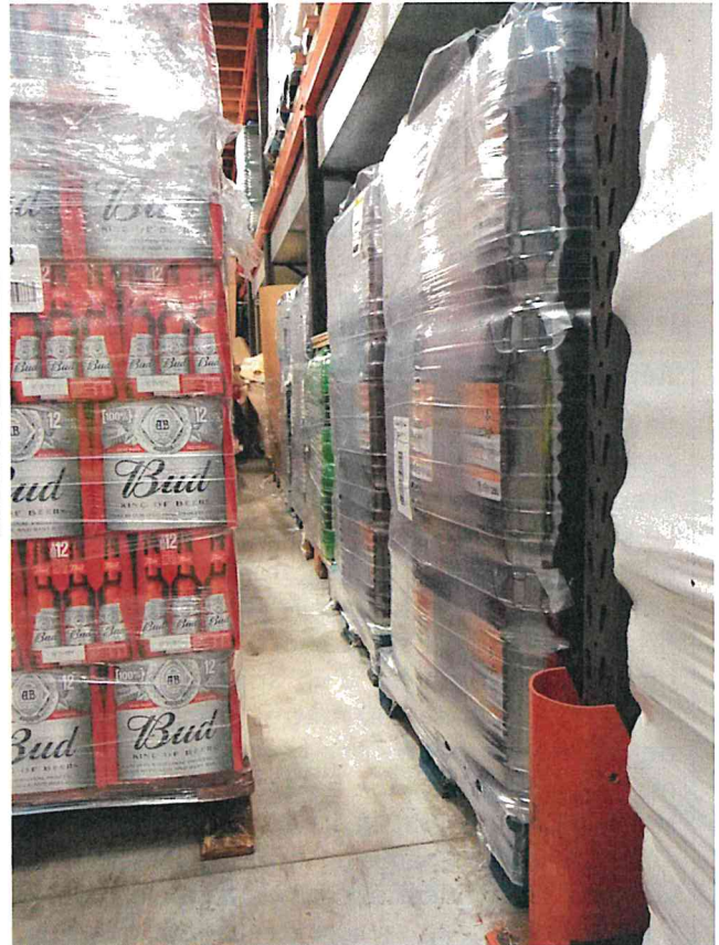
Photo 2 : Palettes de bidons de pétrole lampant entreposées au sol sans rétention