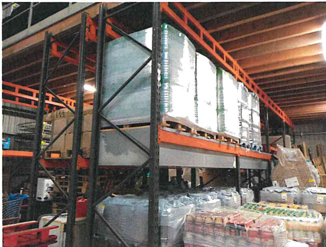
Photo 1 : Palettes de bidons de pétrole lampant entreposées en hauteur sur racks équipés de rétentions. Les rétentions apparaissent toutefois un peu étroites au regard de l'envergure de la palette qui débord légèrement en périphérie.