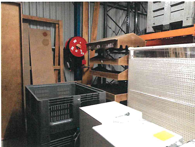
Photo 5 : RIA difficilement accessible en raison d'un encombrement important de l'allée.